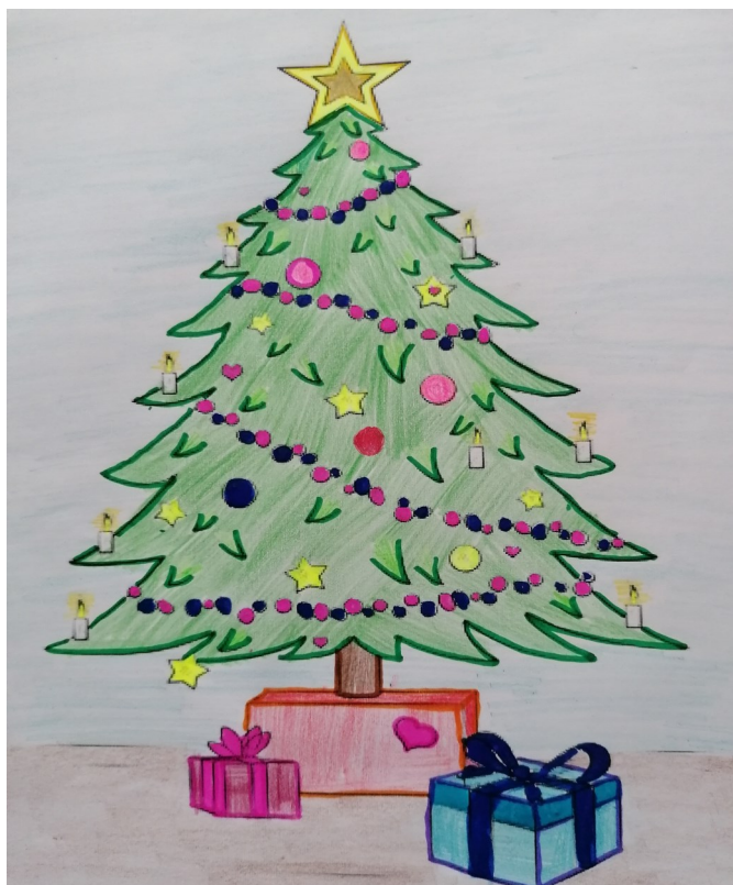
Rys. Patrycja Łacna