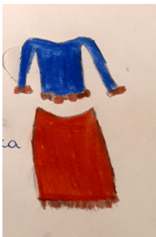
Świetny bawełniany topik z kokardkami i do tego czerwona spódnica z frędzlami.