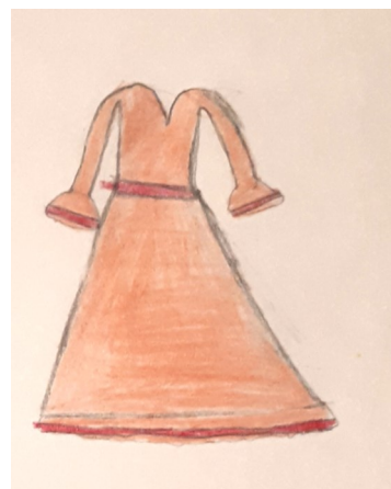
Tiulowa sukienka z falbankami.