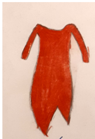
Asymetryczna czerwona sukienka z jedwabiu. Hit każdego balu.