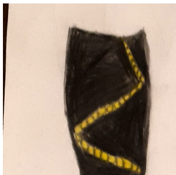
Skórzana spódnica z koralikami.

Oto kilka pomysłów co można założyć na domowego „Sylwestra”. Te kreacje można też wykorzystać na inne okazje.